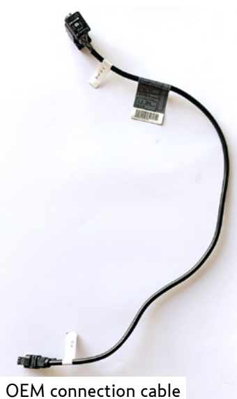
OEM connection cable

Remove the OEM connection cable of the OEM E-throttle by loosening the plug connection beneath the ECU (Picture 2). Also loosen the plug connection on the throttle housing. The OEM connection cable can now be removed.